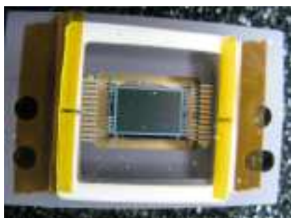
Un exemple d'un capteur CCD (ancien). La zone de détection est le rectangle gris au centre. Remarquez le câblage sur les côtés. C'est lui qui permet la lecture du capteur. Les câbles sont connectés à un convertisseur analogique / numérique à l'intérieur de la caméra.

A l'intérieur d'une caméra CCD, se trouve une plaque de semi-conducteur (constituée de silicium) qui a été compartimentée en un grand nombre d'unités chargées électriquement, des carrés isolés que nous appelons "photo-site". L'ensemble est appelé "capteur CCD". Lorsque le capteur est exposé à la lumière, des photons entrent en collision avec chacun des photo-sites, qui libère des électrons selon le principe de l'effet photoélectrique. Chaque photo-site, associé à d'autres composants électroniques, agit comme un petit condensateur, collectant ces électrons capturés lorsque la lumière les frappe. Chaque photo-site est relié à un processeur central. La charge collectée par les photo-sites s'accumule alors, jusqu'à ce que la puce soit « lue » par l'électronique de la caméra. Pendant l'opération de lecture, le processeur central mesure la charge collectée par chaque photo-site. Il s'agit d'une tension analogique, qui doit être convertie en un nombre, à l'aide d'un convertisseur analogique-numérique. L'information envoyée par le capteur CCD à l'ordinateur est la position du photo-site et une représentation numérique de la quantité de charge détenue au moment de la lecture. C'est ce qui constitue l'image qui résulte de ce système.